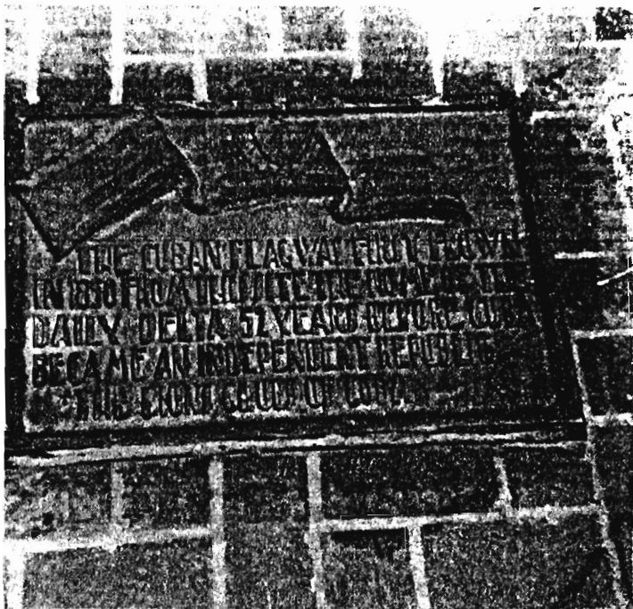
La placa de Nueva Orleans

"Bajo el mando del General Narciso López, la expedición libertadora partió el 11 de mayo de Nueva Orleans con cientos de soldados de Kentucky, Louisiana y Mississippi, a bordo del barco Creole, llevando por pri-