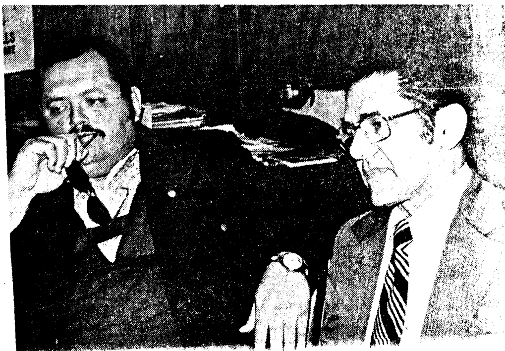
Los Reverendos Espinosa y Caride.

—Amigo mío: porque esa es la única manera de entenderse en el mundo de hoy. Estamos en una era de negociaciones. Yo pido, nosotros pedimos, nosotros gestiona-