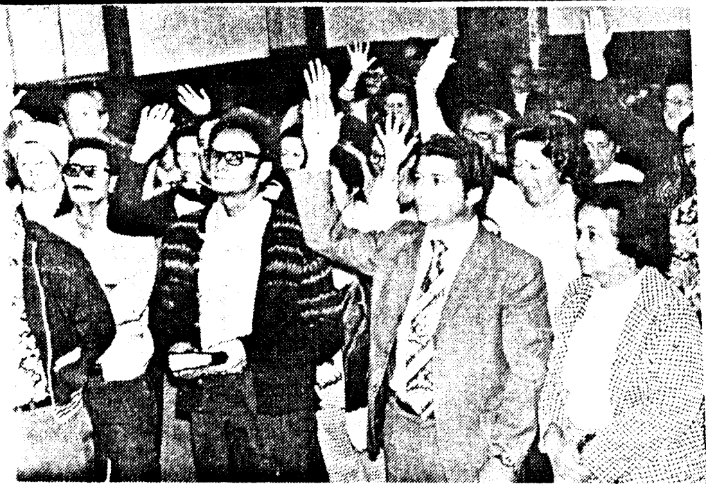
...los fieles en el Templo Pentecostal de la Avenida 27; cuando a ellos le entusiasma un párrafo del sermón de Espinosa, levantan la mano o exclaman ¡Aleluya!.