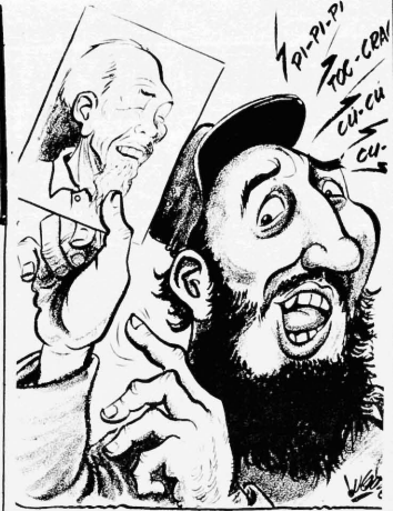
Yo tengo más barba que tu, Ho-Chi-Minh y si tienes un Viet-Nam, yo tengo varios Viet-Nams, ¡e, ¡e, ¡e, ¡e!

Creemos haber esclarecido algunos aspectos del plan, que dieron origen a erróneas interpretaciones. En lo sucesivo, nos limitaremos a esperar la consideración que hagan los llamados a recoger esta iniciativa unitaria, a la que venimos consagrand nuestros mejores esfuerzos.