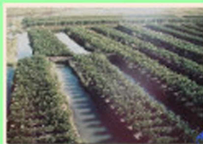
camellones o waru waru

Los waris fueron los primeros en desarrollar la idea de "Urbanismo o ciudades" Lugares como Piquillaqta al este de Cuzco, Wiracochapampa en Huamachuco, Huariwilca en el Callejón de Huaylas, Honqo Pampa en Ancash, Cajamarquilla y Pachacámac en Lima., son ejemplos de la extensión y diversidad de centros Huari.