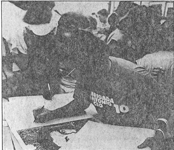
Como constancia de su visita al Taller Experimental de Gráfica de La Habana, firman un grabado en linóleo con el rostro del comandante Che Guevara que el artista Rafael Paneca confeccionó por el 10º aniversario de la brigada Antonio Maceo.

POR MILAGROS OLIVA —de Resumen Semanal—